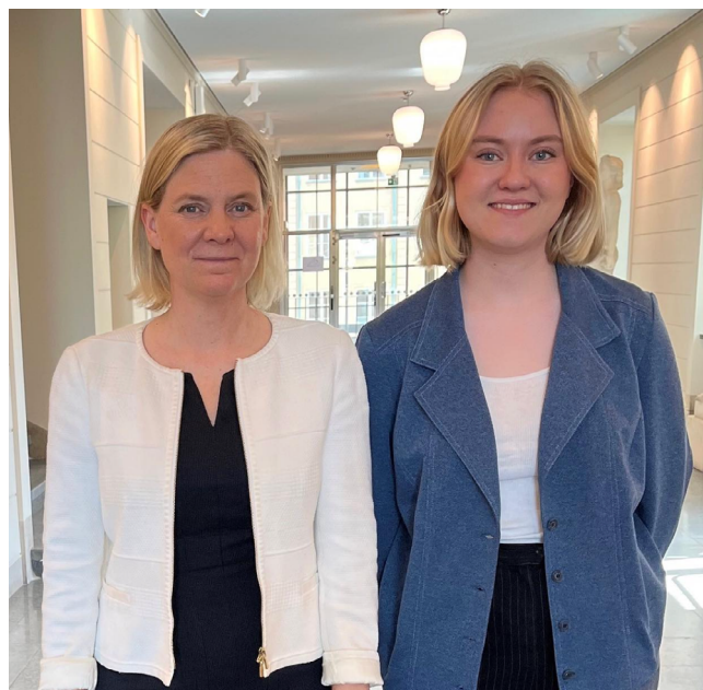
Möte med Magdalena Andersson, Socialdemokraterna

Vi har framträtt i media. Elevernas riksförbund har framträtt i media såsom Nyhetsmorgon, Dagens Nyheter, Sveriges Radio, Altinget och diverse lokaltidningar.