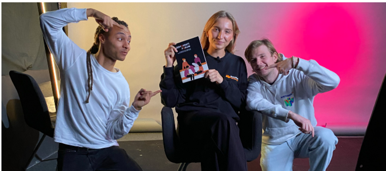
Filminspelning med Liv1 produktion

Vi har samarbetat med Fryshuset. För framtagningen av en film om Demokratiforums metodbok som ska lanseras i oktober har vi samarbetat med Fryshuset och Liv1 produktion. Filmen ger en inblick i erfarenheterna från elever och lärare som varit delaktiga i projektet.