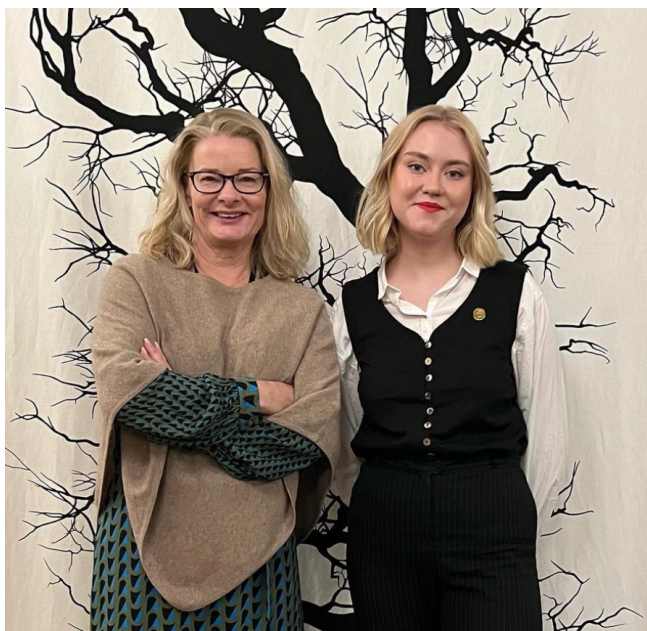
Möte med skolminister Lotta Edholm

Vi har träffat politiker med syfte att påverka för elevperspektivet och gett kommentarer under två riksdagsseminarer. Vi har hållit i möten med skolminister Lotta Edholm och partiledarna för såväl Miljöpartiet, som Socialdemokraterna och Centerpartiet. Utöver detta har vi hållit i möten med de skolpolitiska talespersonerna för Kristdemokraterna, Miljöpartiet och Centerpartiet. Genom dessa möten har vi exempelvis fått möjlighet att ge synpunkter på utformningen av Miljöpartiets nya skolpolitik.