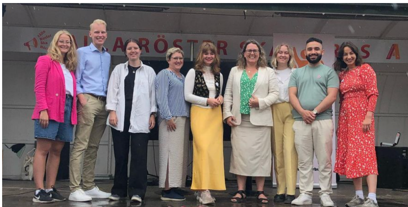
Panelsamtal Almedalen 2023: En mått och trygg skolgång - vems ansvar?

Vi deltog på 34 seminarier och paneler under Almedalsveckan. Utöver detta anordnade vi workshop och mingel tillsammans med nätverket #StoppaYouthWashing och höll i ett eget seminarium med RKUF.